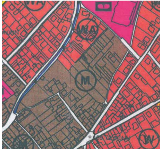
Berichtigter Flächennutzungsplan „Nachher“