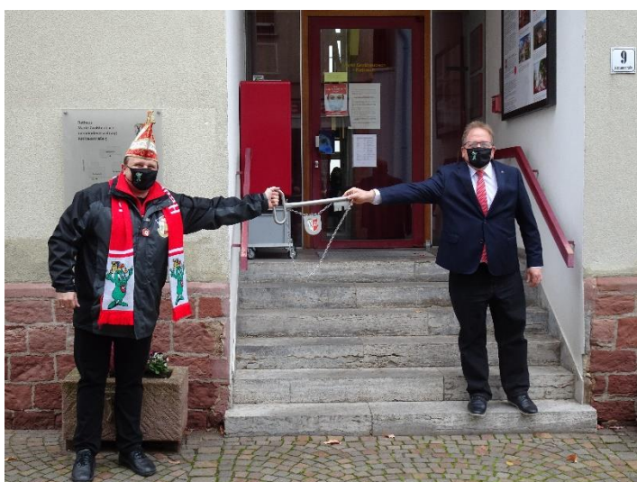
Versöhnlicher Abschluss: symbolische Übergabe der Macht an den Sitzungspräsidenten.