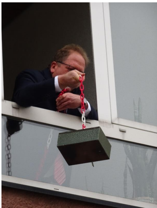
Der Bürgermeister übergibt auch noch die geschrumpfte Gemeindekasse an den Sitzungspräsidenten und verabschiedet sich bis Aschermittwoch in den Urlaub.